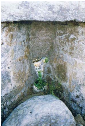
aspillera en el puente fortificado