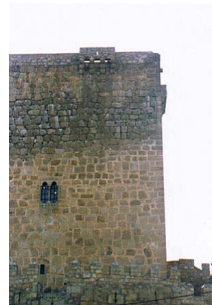
torre y ventana