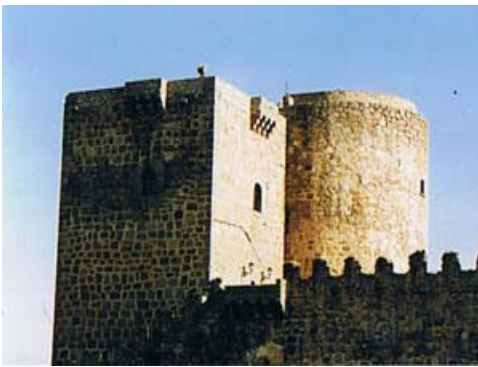
torres del castillo

Es un buen ejemplo de fortaleza señorial de finales de la Edad Media cuya ubicación es estratégica defendiendo y controlando el paso del puente, debido a que se alza en uno de sus extremos, por el que transcurría el camino entre Ávila y Ciudad Rodrigo y hacia Extremadura por la Real Cañada Soriana Occidental.