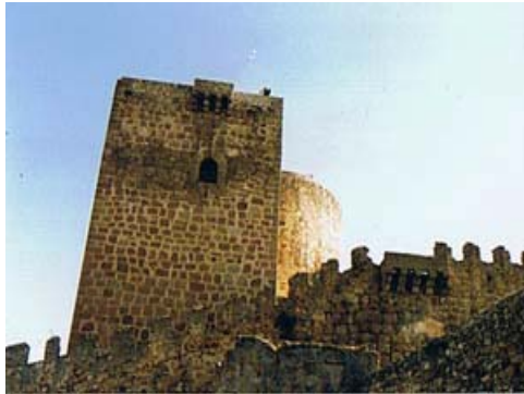
almenas y matacanes en muralla y torres

Se dice que en el interior del castillo existen dos joyas, una escalera de caracol interior que comunica salones y habitaciones; otra es un aljibe, descubierto cuando se restauró la terraza principal, construido en piedra de sillería, revocado con cal e impermeabilizado con sangre de toro.