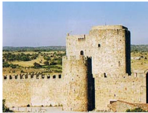
cubo y torres