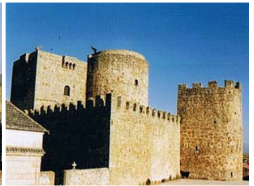
cubo, muralla y torres