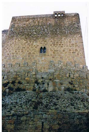
muralla, torre y ventana